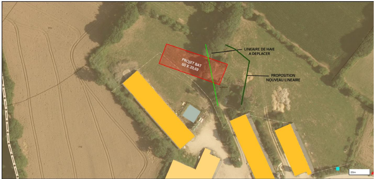
Edité par FVS CONSEILS le 13/09/2022 - Commune: Ténin (73) - Portail Géofoncier